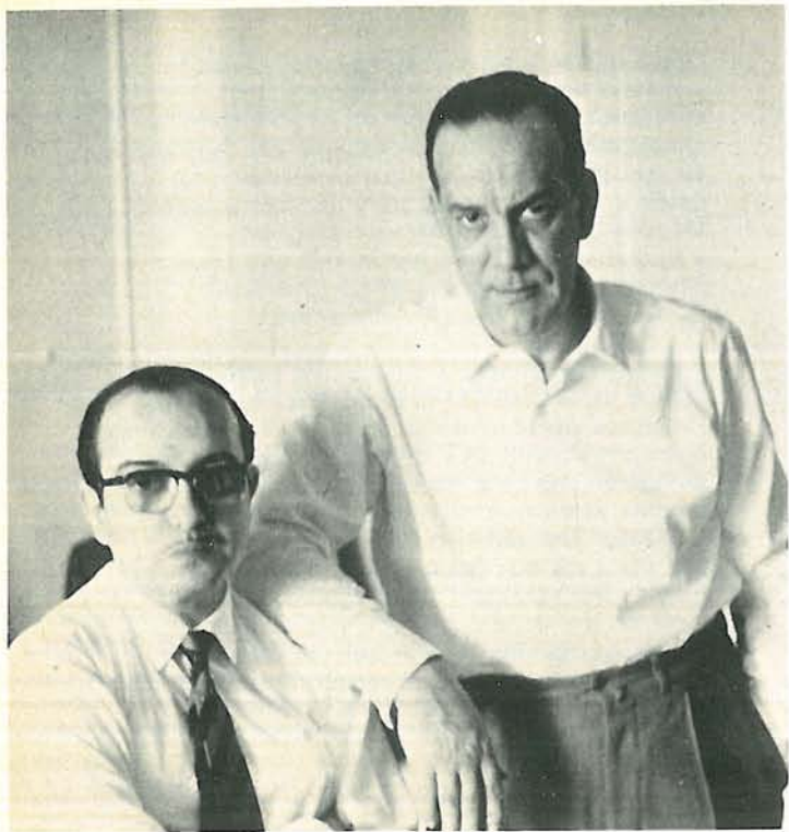
Con Camilo José Cela (1963)