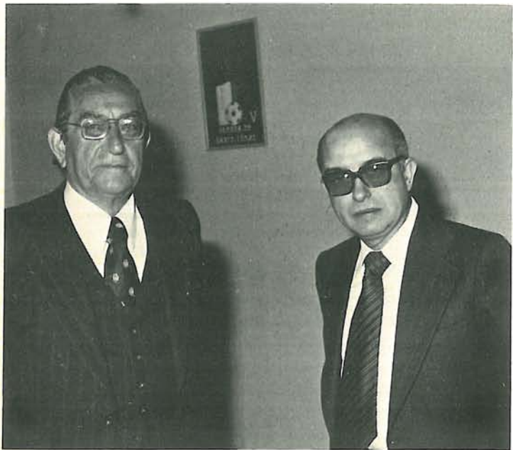
Con el académico y «Premio Cervantes» 1982, Luis Rosales (1977)