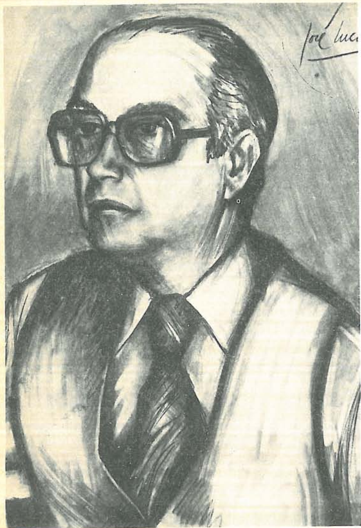
Retrato del poeta, por el pintor José Lucas