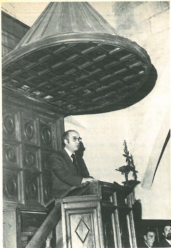
En el púlpito de fray Luis de León de la Universidad de Salamanca (1975)