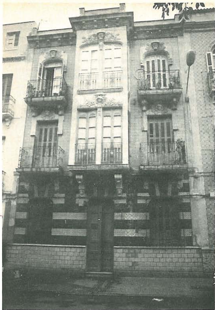
Casa natal del autor, en la calle General Mola, 11, de Melilla