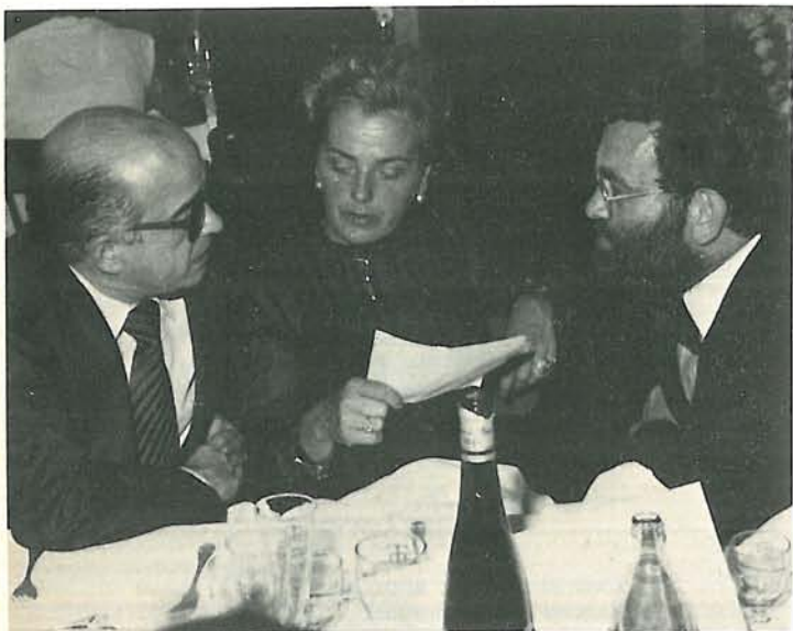
Encuentro de los dos melillenses: Miguel Fernández y Fernando Arrabal. En el centro, la esposa del poeta (1979)